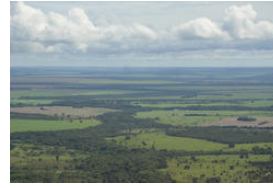
Plano de Gestão do Territ...